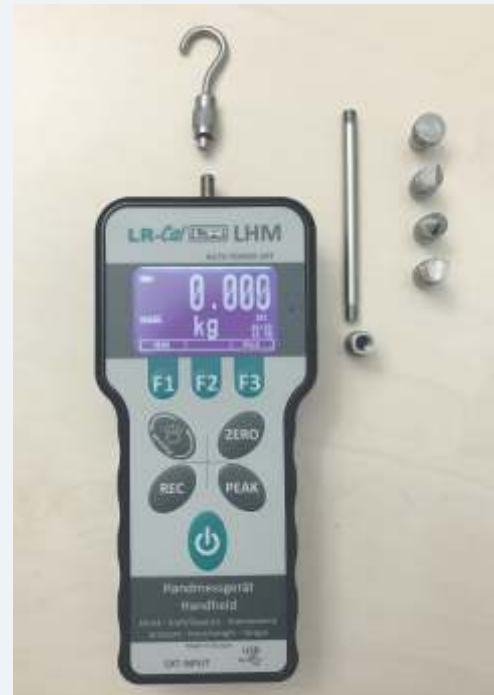
Die Abbildung zeigt auch das optionale Tool-Set mit Haken, Stößeln, usw. zur Aufnahme von Zug- und Druckbelastungen.

• ACCREDIA (DAkKS) Zertifikat für Druckbelastung