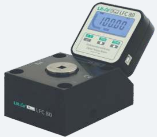
LR-Cal LFC 80